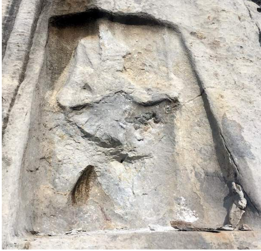
Tahribat Sonrası Durum

toplumun ve devletin ortak görevidir ve bu konuda tüm taraflar üzerine düşeni yerine getirmelidir.