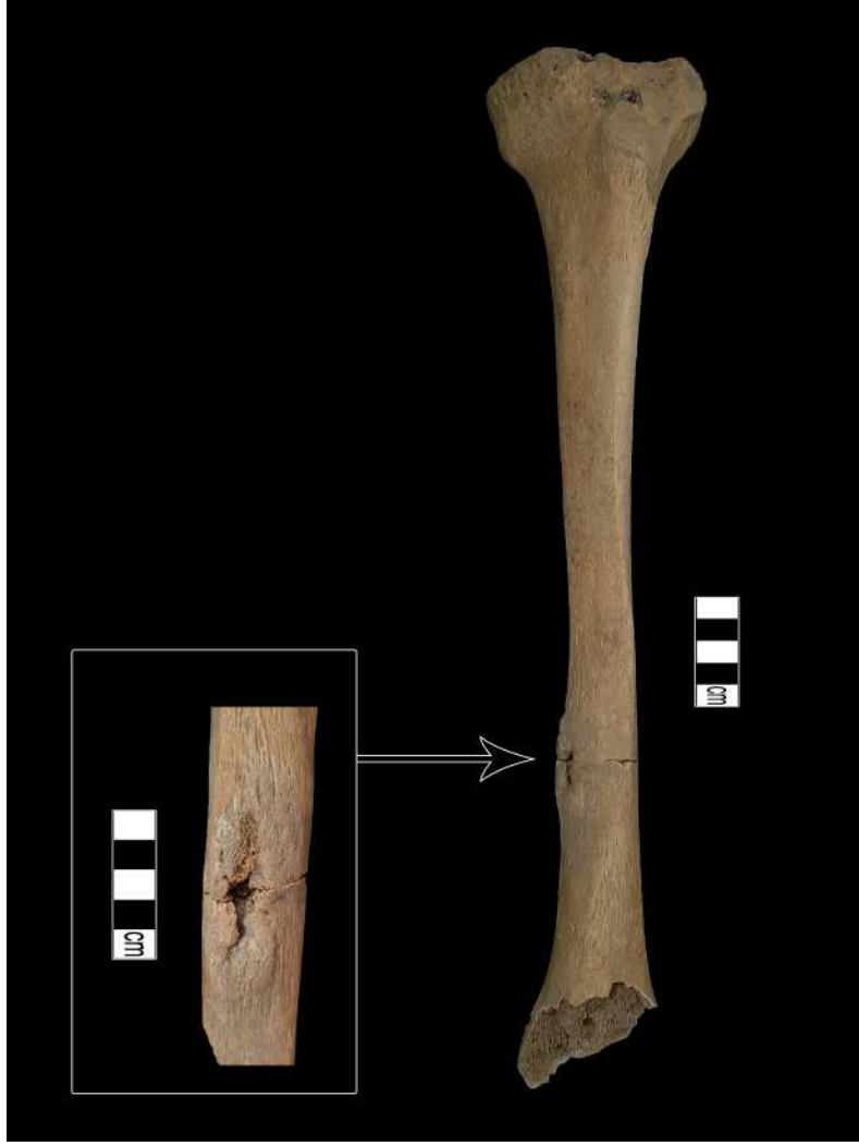
Resim 2. Tibiada osteomyelit.