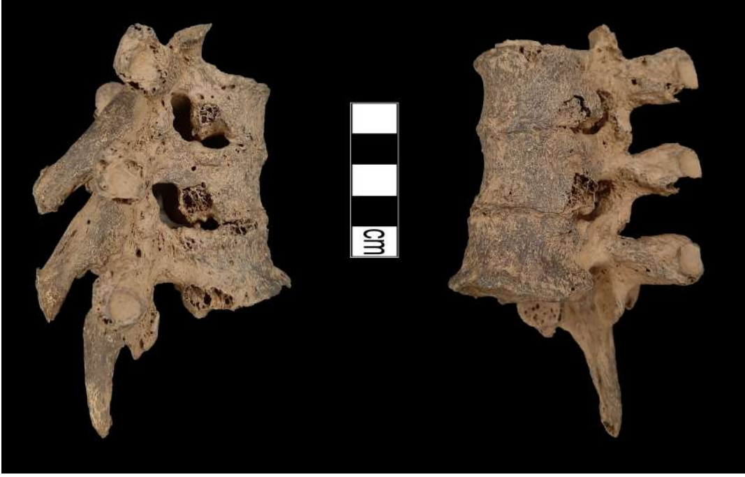
Resim 6. Üç omurun birleşmesi.

kemiklerinde (Resim 8-9) ve coxae kemiklerinde deformasyonlar tespit edilmiştir. Bu birey ile aynı mezardan çıkarılan ileri yaşlı erkek bireyin parmak kemiklerinde de artirit gözlenmiş olup, üç parmak kemiği ileri seviyede artirite bağlı olarak bütünleşerek tek bir kemik halini almıştır (Resim 10).