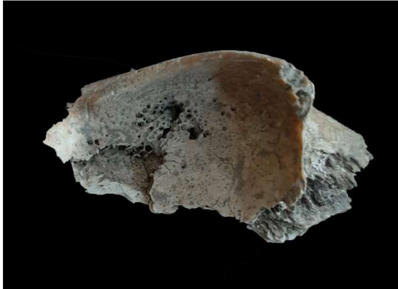
Resim 3. Cribra orbitalia.