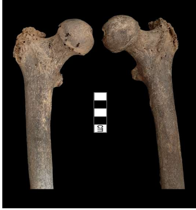
Resim 8. Femurlarda deformasyon.