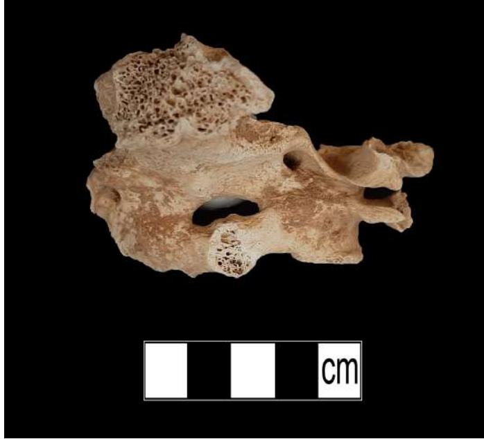
Resim 5. Atlas oksipitalizasyonu (4 numaralı resimdeki lezyona sahip birey).

Örnekleme içerisindeki en dikkat çeken patolojik olgu, 50-55 yaşlarında kadın bir bireyin vücut kemikleri üzerinde tespit edilmiştir. Bireyin bütün omurlarında (30 omur) farklı seviyelerde osteofit ve birçok omurunda Schmorl Nodülü gözlenmiştir. Ayrıca, iki bölgede omurlar birleşerek kemikleştiği gözlenmiştir (Resim 6-7). Bireyin parmak kemiklerinde artirit, uzun