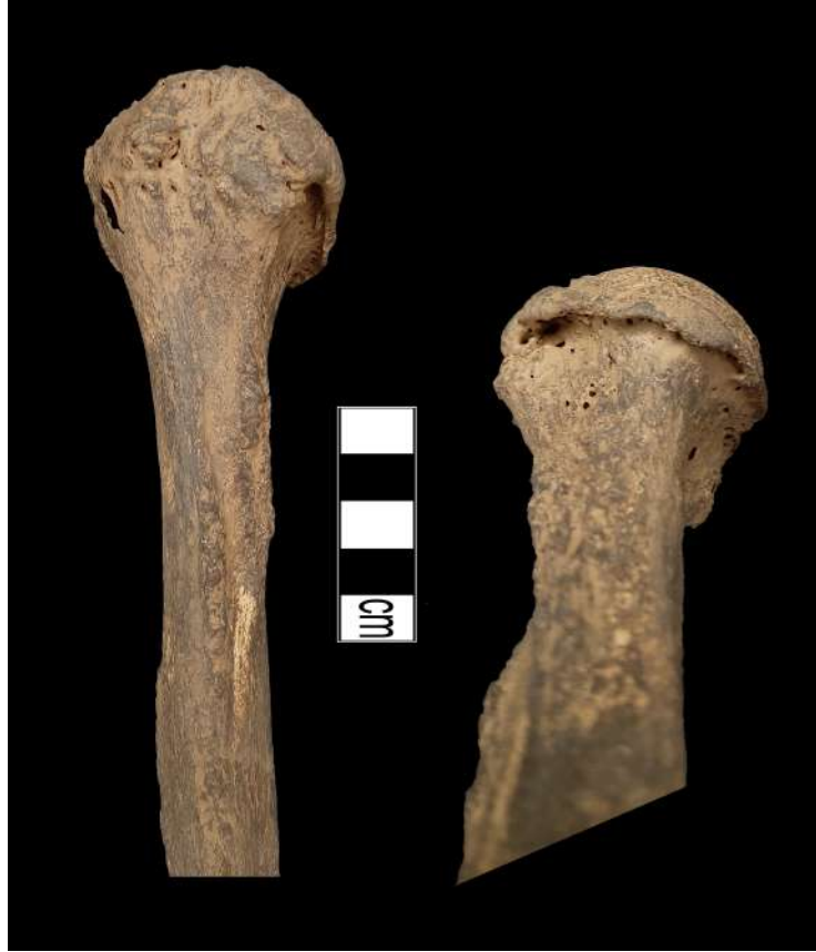
Resim 9. Humerusda deformasyon.