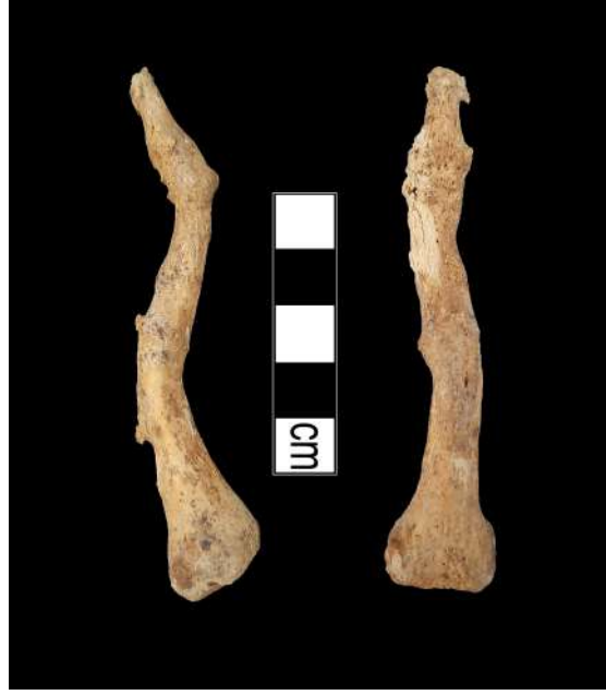
Resim 10. Artirit sonucu parmak kemiklerinin birleşmesi.

İskelet serisi üzerinde en sık rastlanan patolojiler omurlarda gözlenmiştir. Hellenistik Dönem'e tarihlendirilen iskelet serisi içerisinde yalnızca 18 omur tespit edilmiş, bunların da bir tanesinde osteofit gözlenmiştir. Roma Dönemi iskelet serisi içerisinde ise 12 omur tespit edilmiş, herhangi bir patoloji gözlenmemiştir. Bizans Dönemi daha fazla sayıda omur ile temsil edilmektedir. 10 erkek bireye ait 170 omur incelenmiş; 13 Schmorl Nodülü ve 4 osteofit gözlenmiştir. Tespit edilen Schmorl Nodülleri ve osteofitlerin hepsi sırt omurlarında gözlenmiştir. İncelenen 2 kadın bireye ait toplam 14 omur üzerinde ise herhangi bir patoloji gözlenmemiştir.