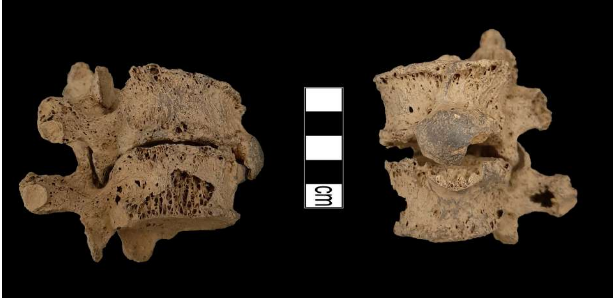
Resim 7. İki omurun birleşmesi.