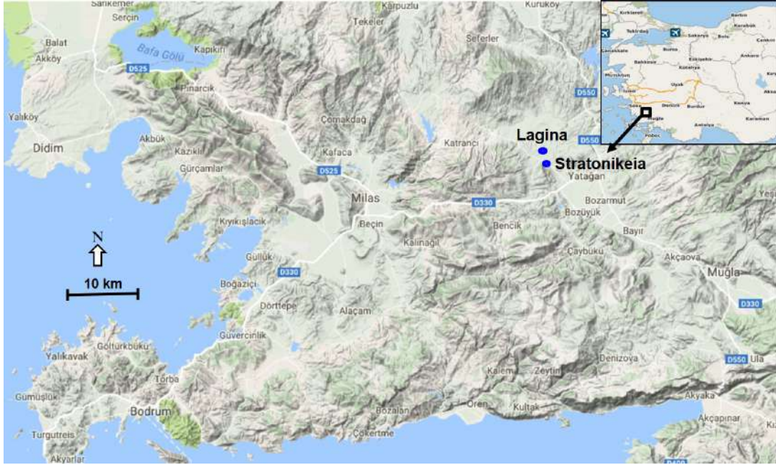
Resim 1. Stratonikeia Antik Kenti ve Lagina Hekate Kutsal Alanı (Kumsar ve Aydan 2019: 268).

Roma İmparatorluk Dönemi'nde ise Hadrianus ve Antoninus Pius zamanında (MS 117-161) kısa bir süre için kentin isminin Hadrianoupolis olduğu bilinmektedir (Magie 1950: 995-996; Aydaş 2012: 61-64; Sögüt 2013: 614).